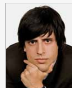
Modell: Skin lite komplett