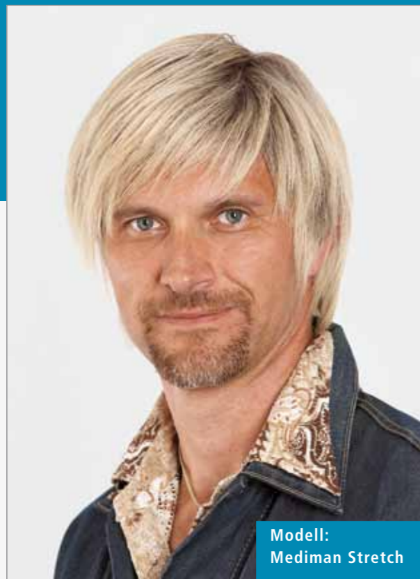
Modell: Mediman Stretch

Unsere vielseitige Modellauswahl ist die Basis für Ihre typgerechte Lösung