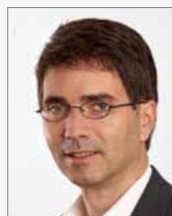
Modell: Hair Med Men 2