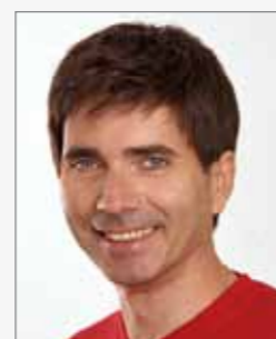
Modell: Aqua komplett