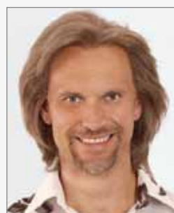
Modell: Hair Med Men 1

Wir decken alle Möglichkeiten ab. Ihr Fachstudio berät Sie gerne zu Ihrer Ideallösung.